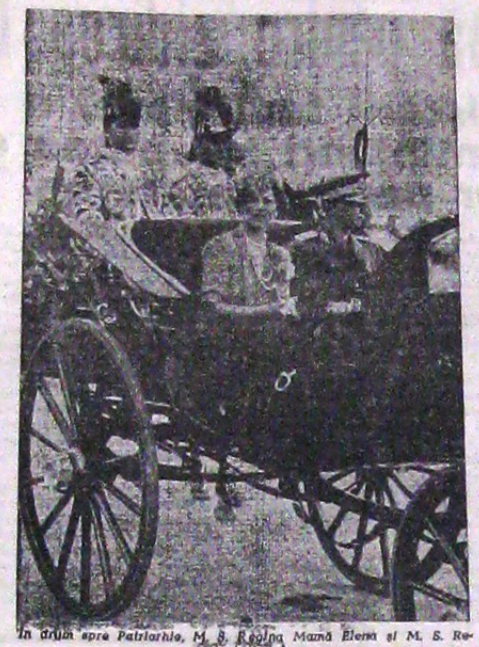
În drum spre Patriarhie, M. S. Regina Mamă Elena și M. S. Regele Mihai I