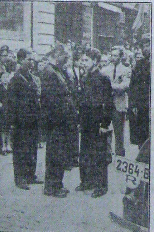
D. Horia Sima primind rapoartele Comandanților Legionari

fragmente a unui sau două avioane inamic evident distruse de artileria antiaeriană, căzând dela mare înălțime. În același timp s-au văzut pașate scoborînd.