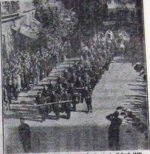
Înmormântarea legionarilor uciși la Constanța (7 Sept. 1940).