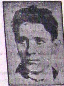
(Circulările Capitanului, p. 52)

Să arătăm țării noastre că s'a născut în sfârșit o mână de tineri, pe acest pământ românesc, creșcuți în credința legionară și cari ne încumetăm să ne măsurăm în vrednicie cu oricine.